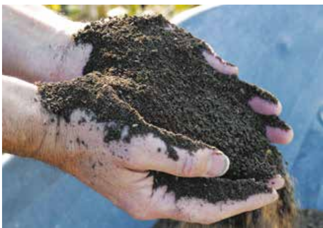
Le compost mûr se caractérise par sa couleur foncée et sa structure grumeleuse.

Il favorise la croissance des plantes et leur développement racinaire.